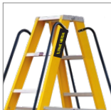
Barandas de seguridad

*Los accesorios de las escaleras se venden por separado y complementan su funcionamiento. Para consultas, contacte a su asesor comercial.